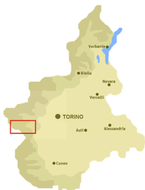
Fig. 1 - Val Germanasca e Val Chisone Piemonte, Italia settentrionale

Poi, tutta quella preziosa materia prima, con le caratteristiche chimico-fisiche e tecnologiche dette in precedenza, fu adibita a quelle numerose lavorazioni che tanto profitto hanno dato ai produttori e ai commercianti. L'ultimo anello della catena d'esposizione, gli acquirenti-utenti dei beni di consumo finali, ha ricevuto nuovo comfort, ed ha fruito di stili di vita piu' eleganti e meglio igienizzati, ad opera dell'uso di talco. L'esordio dell'impiego del talco nella vita civile è avvenuto pressoché in parallelo con quello dell'asbesto, non solo per l'aspetto dei tempi, ma soprattutto perche' il primo minerale poteva essere inquinato in natura da frazioni variabili, talora consistenti, del secondo. Come si vedrà in seguito, la letteratura scientifica non assolve il talco a pieni voti, come se fosse del tutto innocuo. Tuttavia, al tempo della formazione primordiale del nostro pianeta, la natura delle materie prime (cationi ed anioni) e delle condizioni fisiche che hanno accompagnato il fenomeno cosiddetto del big bang (temperature e pressioni) hanno portato alla